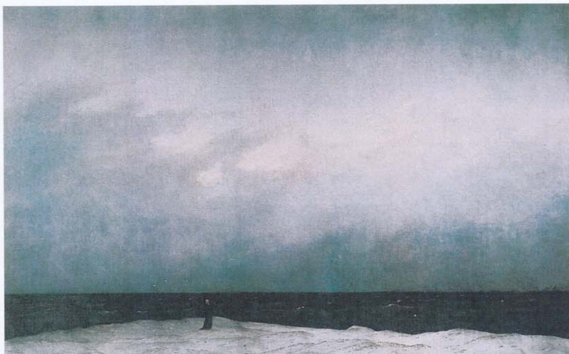
Caspar David Friedrich, Der Mönch am Meer , 1808-1, Öl auf Leinwand 110X171,5 cm