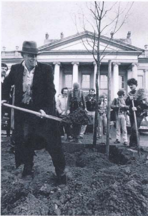
Joseph Beuys, 7000 Eichen – Stadtverwaltung statt Stadtverwaltung , Kassel, 1982,