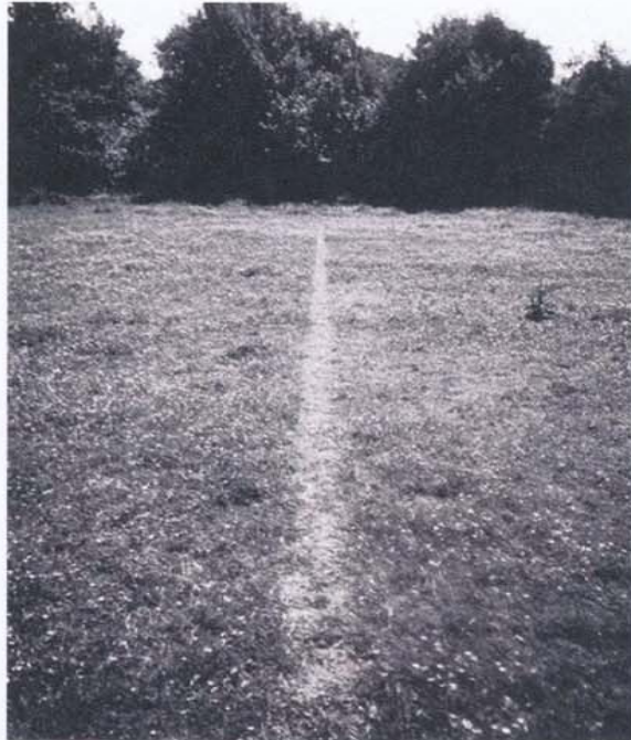
Richard Long, A Line made by walking , England 1967