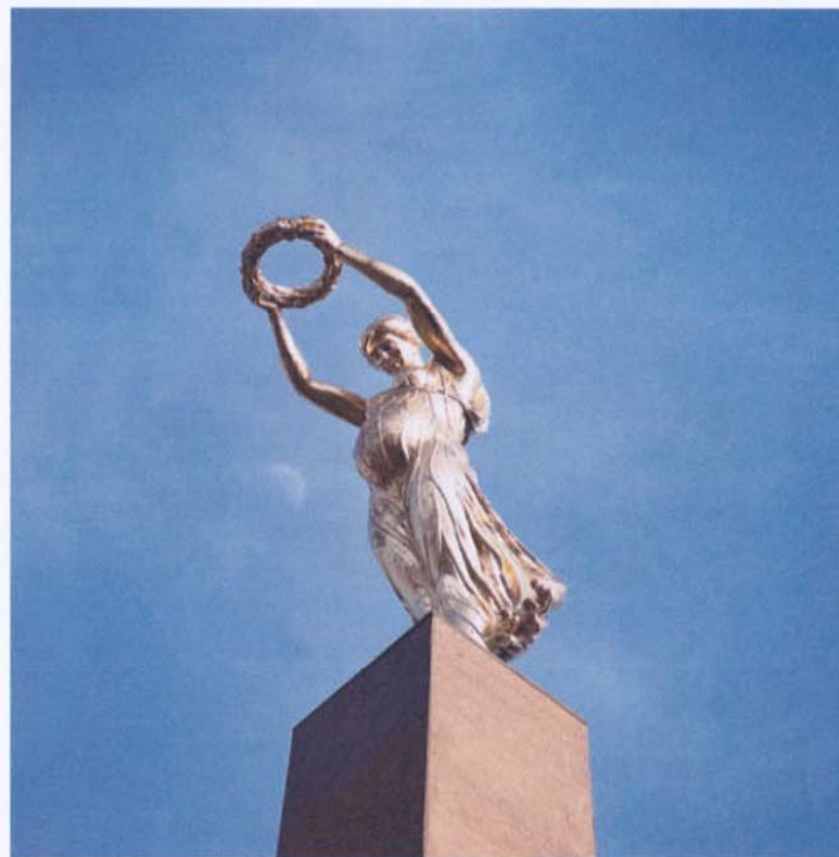
Sanja Iveković, Lady Rosa of Luxembourg , 2001, installation dans l'espace public pour l'exposition " Luxembourg, les luxembourgeois ", Casino Luxembourg—Forum d'art contemporain et Musée d'histoire de la Ville de Luxembourg, 31 mars – 3 juin 2001, Luxembourg-ville.