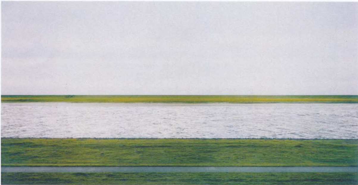
Andreas Gursky, Rhein , digital bearbeitete Fotografie, 1999, 185,4 × 363,5 cm