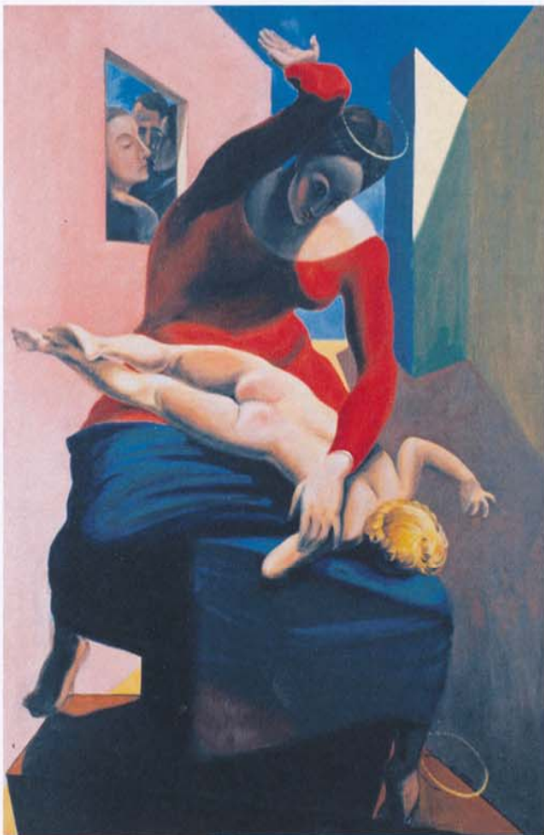
Max Ernst, La vierge corrigeant l'Enfant Jésus devant trois témoins : André Breton, Paul Eluard et le peintre, 1926, Huile sur toile, Collection Centre Pompidou.