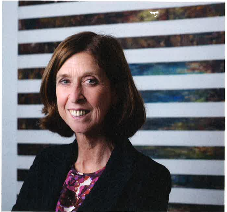
LYDIA MUTSCH, ministre de la Santé

À l'heure actuelle, les étudiants en médecine sont obligés de poursuivre leurs études à l'étranger après une première année à l'Université du Luxembourg. Un nombre non négligeable d'étudiants décident de poursuivre leur carrière active dans le pays de leurs études, après la fin de celles-ci. Si le Luxembourg a conclu des accords bilatéraux avec certaines universités étrangères afin de réserver un contingent fixe de places à des étudiants luxembourgeois, ce contingent ne suffit plus à accueillir tous les médecins en herbe du Grand-Duché. De plus, ces accords risquent d'être mis en cause à l'avenir lorsqu'on sait que de nombreuses universités dans d'autres pays essaient de limi-